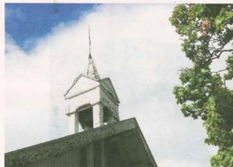
UTE AV DRIFT: Matklokkene i Ringsaker ble overflødige da folk flest fikk klokke på armen.