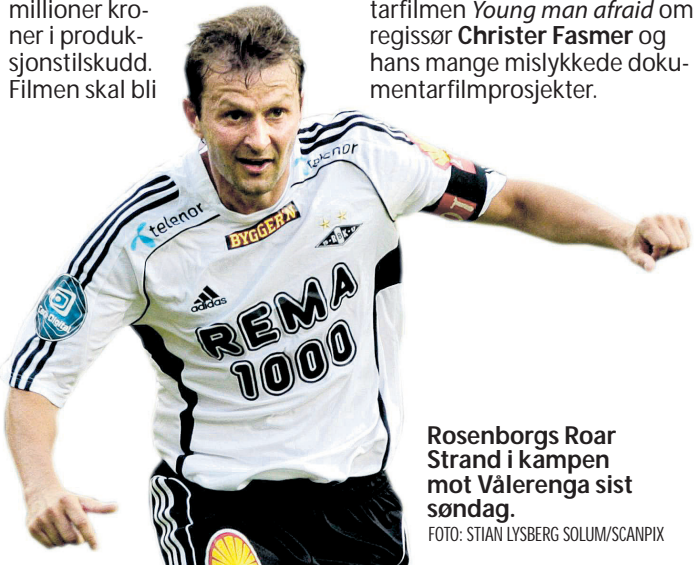
Rosenborgs Roar Strand i kampen mot Vålerenga sist søndag.