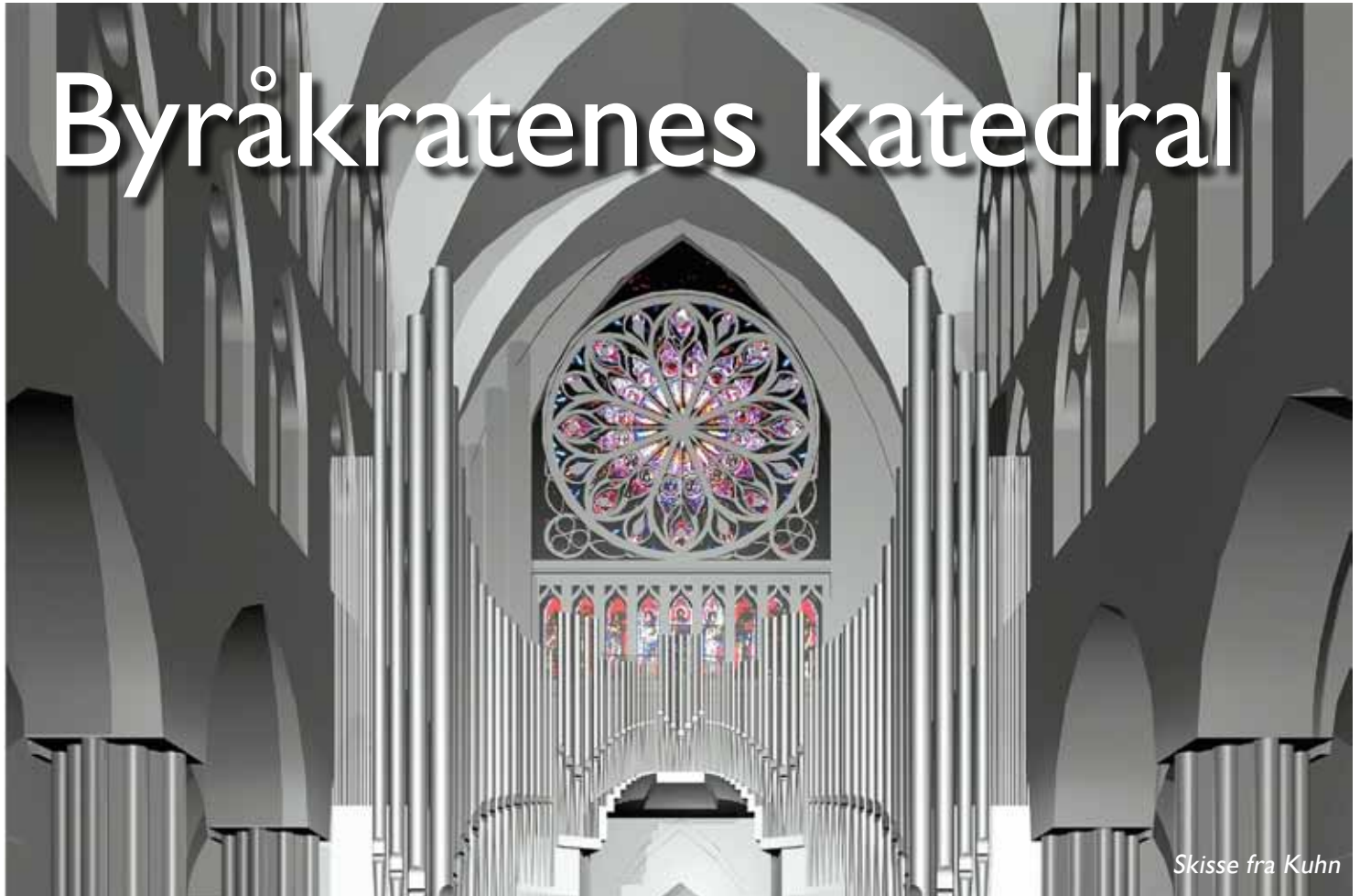
Skisse fra Kuhn