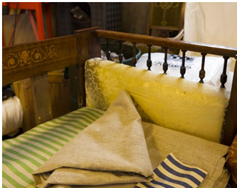
Gammelt møter nytt. Det eldste trekket i lysegrønn silkedamask fjernes, men et stoffstykke sys inn i ryggen som dokumentasjon på det som en gang var.