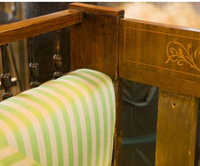
Detalj av sofaen med det nye trekket fra Klässbolls