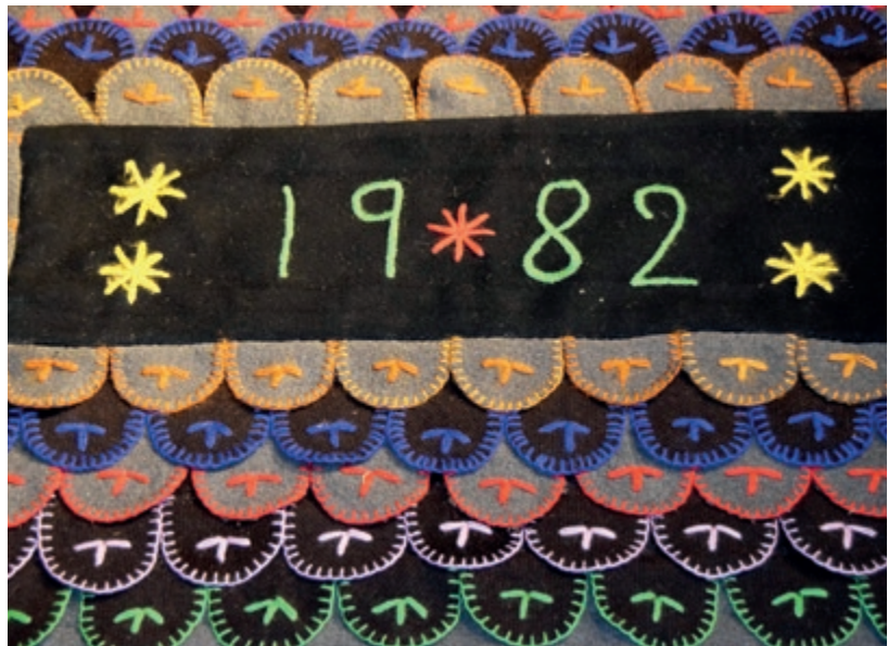
Stor sengeforlegger fra Odalstunet, med vekt på symmetri og fargebruk

– Det er lett å si at ting var bedre før. Det var det nødvendigvis ikke, men rammevilkårene for husflid har endret seg i takt med samfunnet ellers. Når bestemor ikke lenger strikker, og formingslæren mangler fagbakgrunn, gir det føringer for hvordan vi i Husflidslaget skal jobbe. Vi mener at husfliden, håndens gjerning, representerer noen helt grunnleggende verdier. For barn handler det om følelsen av mestring. Alt håndverk, enten materialet er tekstil, metall eller tre, stimulerer motorikken. Du lærer om farger, om form og funksjon. Og om kvaliteter. Tenk deg matkunnskapen hos norske husmødre på 1950-tallet sammenliknet med den vi ser foran butikkdiskene i dag. De gransket kjøttstykkene hos slakteren og så helst at fisken ble slaktet idet de kjøpte den. De visste hva de ville ha, og så nytten av å vite. Det ga dem autoritet og selvfølelse. Det samme gjelder husflid. Livet blir så mye rikere når du forstår sammenhenger, kjenner tradisjonen og skaper ting med egne hender. I dag sorteres ull etter 16 kvaliteter. Men på 1970-tallet opererte man med 52. Hva forteller det om utviklingen? Hva er «norsk