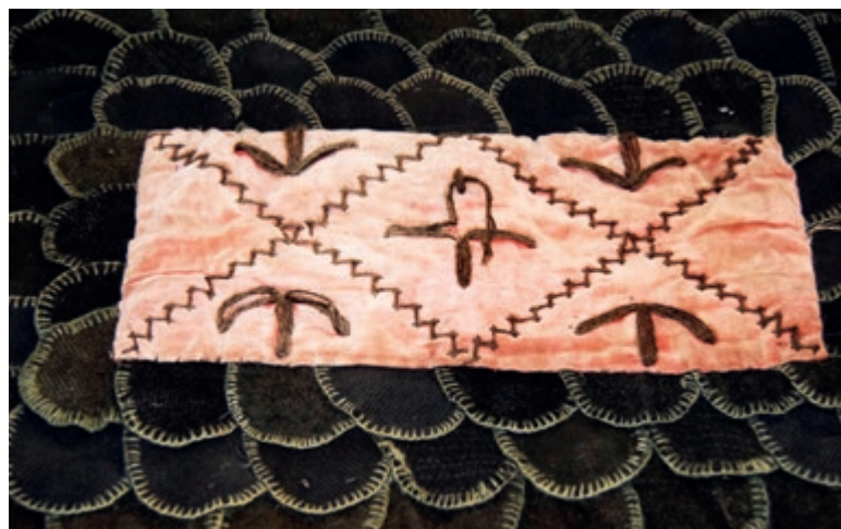
Eksempler på hæltepper