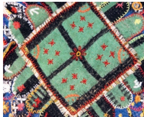
Teppe sydd de siste årene, med materialer av gamle, slitte ulltepper

silke og ull. Vi behersker de samme teknikkene, vi kan vurdere datidens arbeid og dele deres materialer inn i våre kvaliteter. Vi kan vurdere deres arbeid. De som skapte tekstilene, er glemte, men med håndverkstradisjonen som bindeledd blir de likevel levende for oss. Gammel husflid er som den ukjente soldats grav. Du kjenner ikke lenger navnene, men du fornemmer menneskene likevel. 🌀