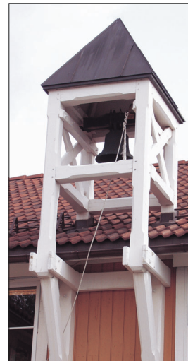
Klokka som henger i dette tårnet har vært på vandring fra Baldishol kirke på Nes, via Aadals Brug, til Klevfos for å ende opp som klokke på Ådalsbruk oppvekstsenter.