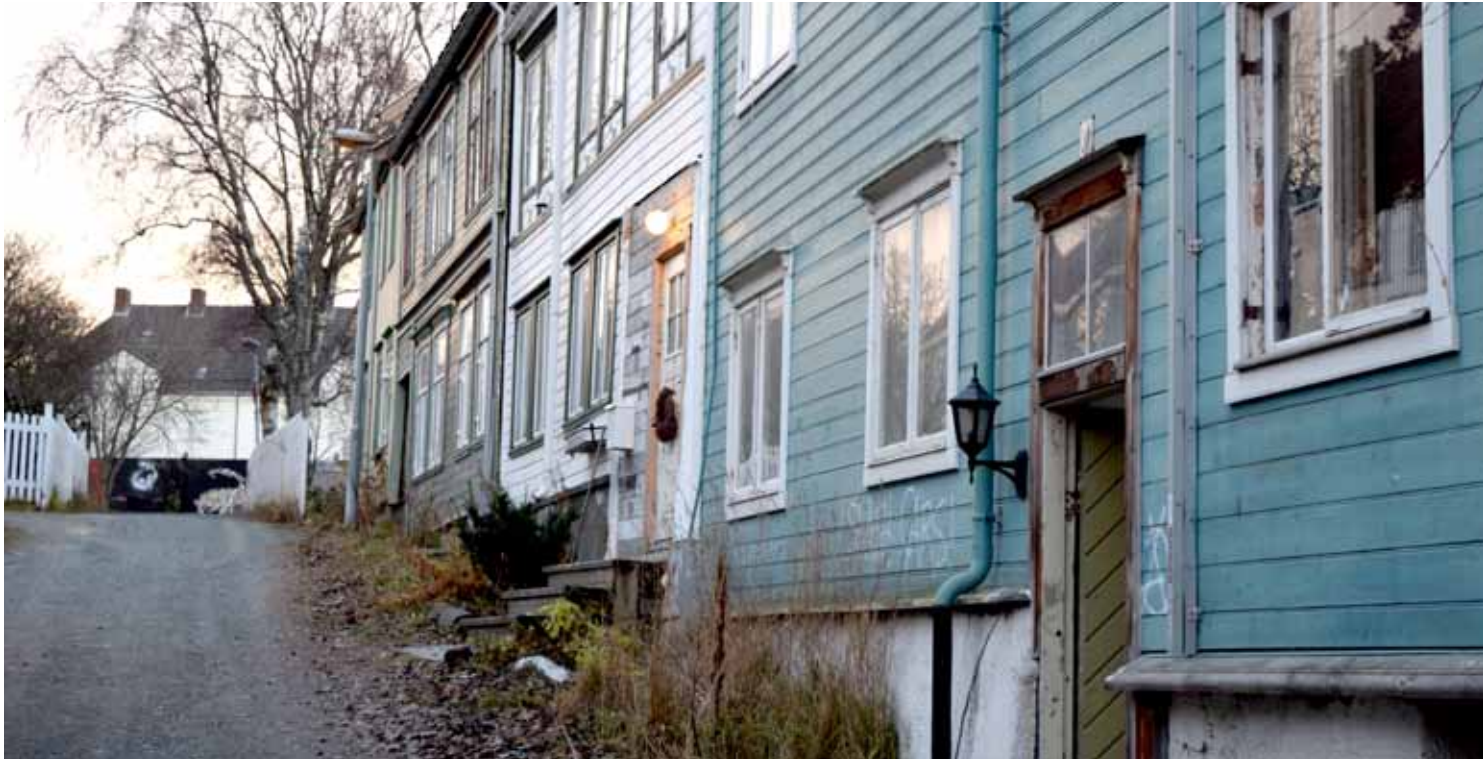
Trenger støtte: Det inviteres til seminar i Verkstedhallen på Svartlamoen. Svartlamoen boligstiftelse, Trondheim kommune, Fortidsminneforeningen er blant dem som stiller seg bak.