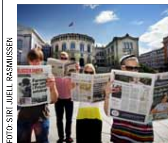
Fortsatt mangfold?: Det kuttes hardt i norske redaksjoner.