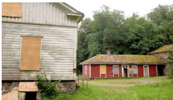
Må avklares: Dagens Breidablikk-seminar skal se på hva som gjemmer seg bak begrepet vern gjennom bruk.

Han peker på at det det norske landbruket råder over en enorm bygningsmasse og det er et nasjonalt ansvar å forvalte den. – Gjengroing og bygningsforfall er to sider av samme sak. Det handler like mye om å tenke tradisjonelt