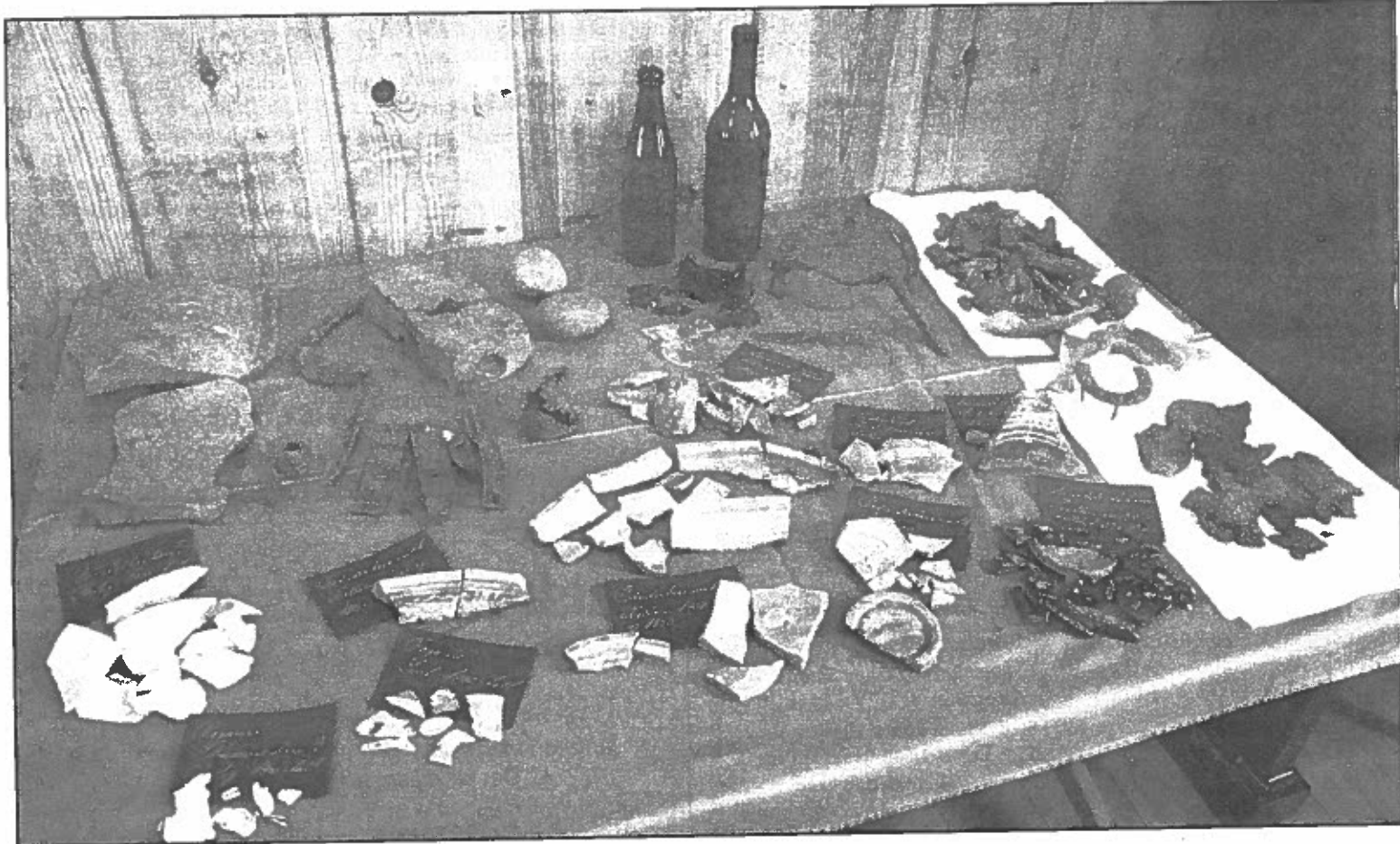
UTSTILLING: Gjenstander elever ved Tangen skole hadde funnet, ble vist fram på Tangen Menighetshus.